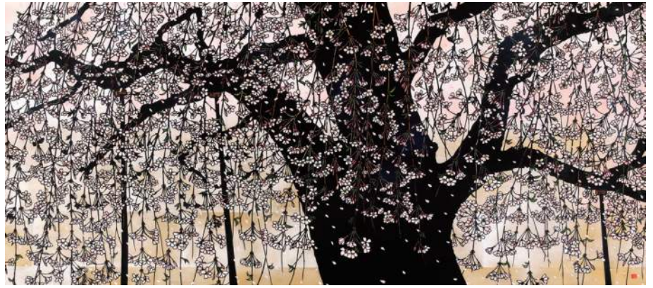
《しだれ桜》2020年 久保修切り絵ミュージアム蔵