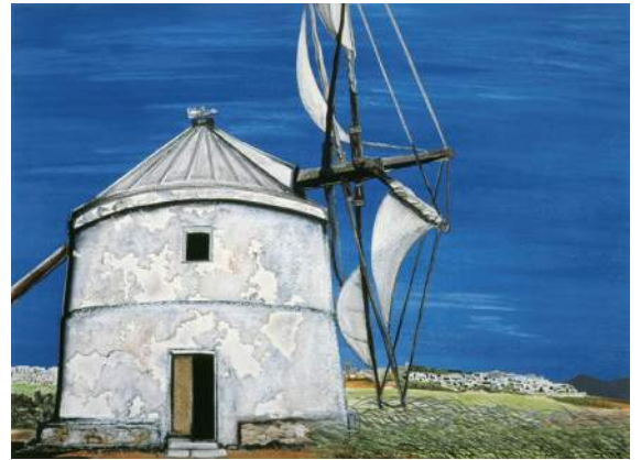
《風車 (南スペイン)》1985年