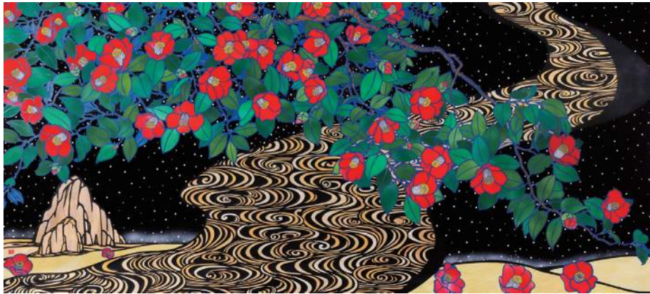
《椿流水図》2020年 久保修切り絵ミュージアム蔵

阪神淡路大震災での被災経験や47都道府県を巡る旅を経て、自然災害によってそこに在った文化や風景、人々の暮らしが失われてゆく様子を目の当たりにした久保は、日本の原風景を切り絵にして残していく「紙のジャポニスム」と題した活動をスタートさせます。その活動は国内にとどまらず、2009年に文化庁文化交流使に任命されて以降は展覧会やワークショップなどの事業を計16か国で開催し、切り絵を通して世界中の人たちに日本文化を紹介しています。本展では、美しい日本の原風景を切り取って描き、世界や未来に向けて発信しつづけている久保修の作品を初期から近作まで幅広くご覧いただけます。